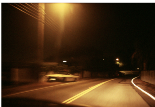
© Laure Vasconi courtesy galerie Sit Down