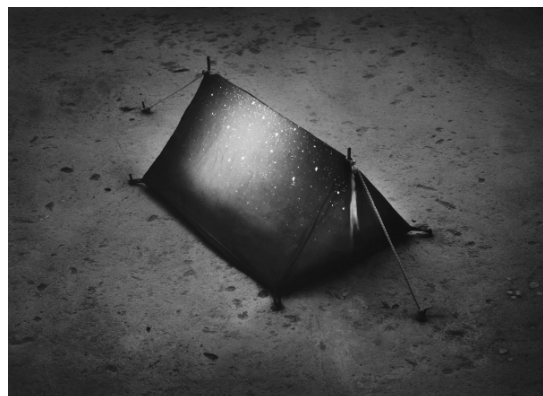
© Agnès Propeck courtesy galerie Sit Down