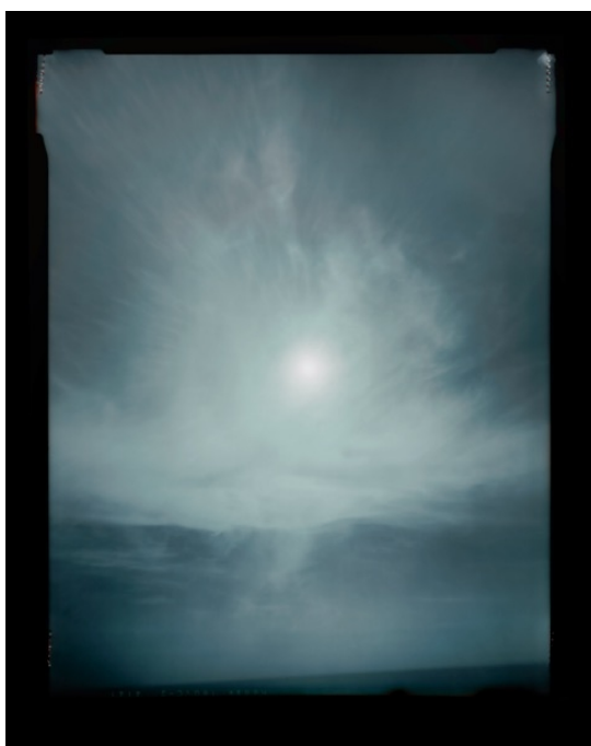
© Jean-Gabriel Lopez courtesy galerie Sit Down